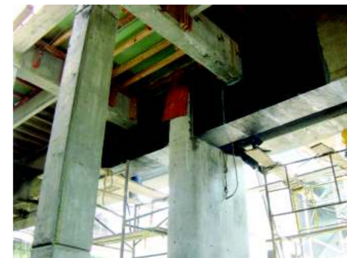
Figura 3. Colocación del tejido de fibra de carbono SikaWrap 300C.

El proceso de colocación del tejido de fibra de carbono SikaWrap 300C en las vigas implicó unos trabajos previos de preparación de la superficie como: redondeado de las aristas de las vigas para evitar concentración de esfuerzos en el tejido, limpieza de la superficie con pulidora para quitar rebabas, agentes desmoldantes y corregir imperfecciones.