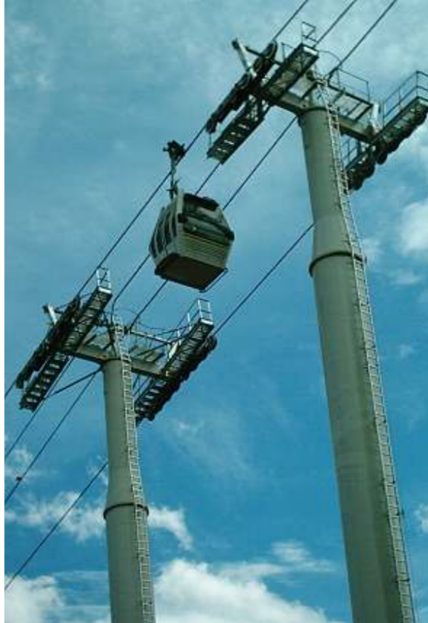
Las pilonas son columnas metálicas que sostienen el sistema de vagones

Dueños del Proyecto: Municipio de Medellín y Metro de Medellín.