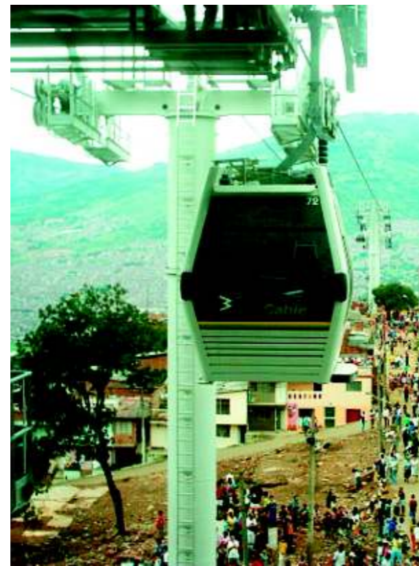
Vagón en funcionamiento

El proyecto de Metrocable nace de la necesidad de mejorar las condiciones de movilidad de los habitantes de los barrios de la parte alta nororiental de Medellín, que usan el sistema de transporte Metro cada día, y que debían caminar grandes distancias o utilizar buses de servicio público para llegar a las estaciones del Metro. Con Metrocable se mantiene la calidad de servicio del Metro a lo largo de un corredor aéreo, que moviliza a esas personas de manera rápida, segura y más económica. Con este proyecto se mejora la calidad de vida de la población de menores ingresos y permite a las zonas de más difícil acceso vehicular, un transporte público adecuado con tarifas razonables.