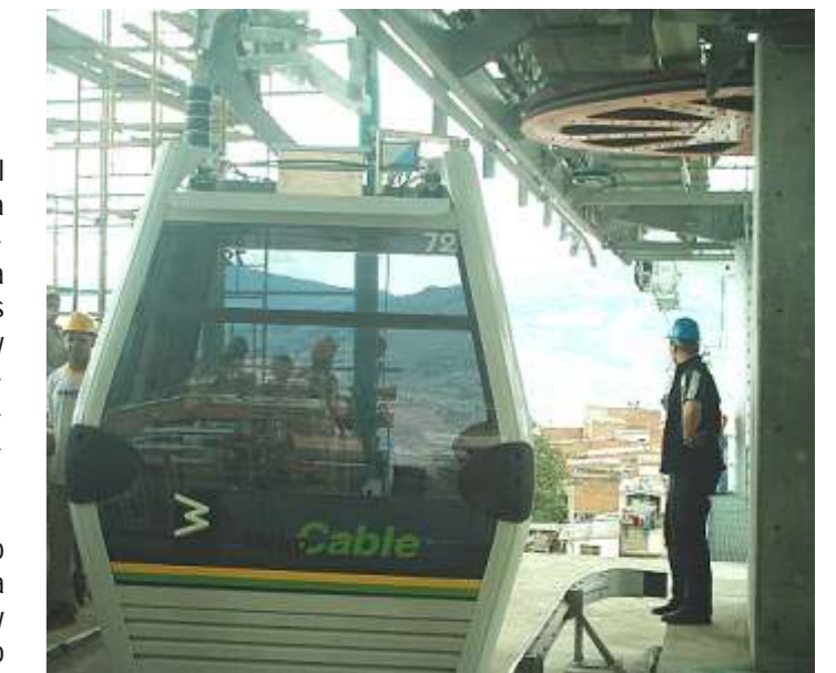
Zona de abordaje de los vagones

Las 20 columnas metálicas, denominadas pilonas, que sostienen los cables por donde circulan los vagones son estructuras muy importantes del proyecto Metrocable. Su cuerpo está hecho de acero al carbono, con forma circular y con altura variable entre 11m y 33 m. Fueron fabricadas por la industria