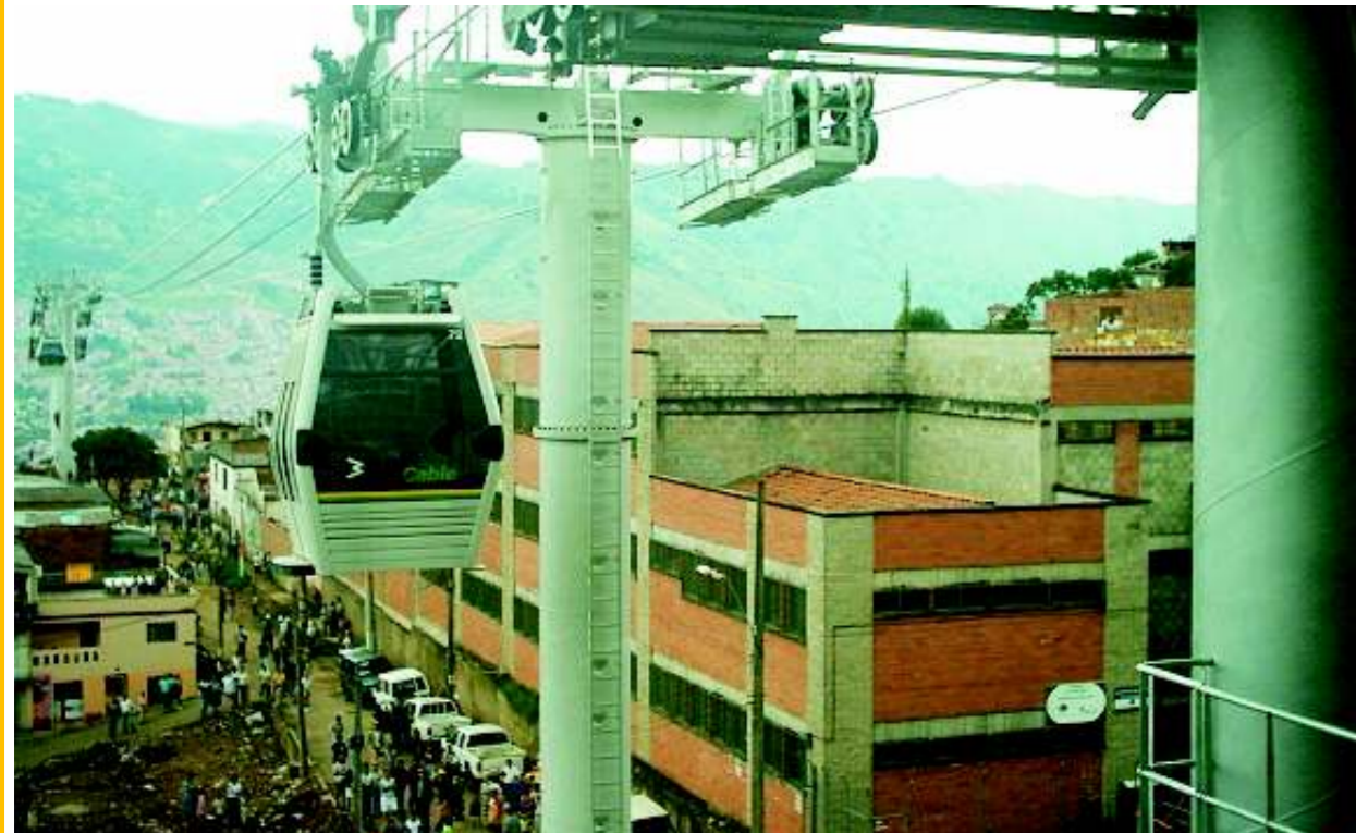
Llegada de los vagones a una de las estaciones intermedias