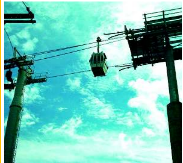
Panorámica de un vagón en funcionamiento

Metrocable es una obra de ingeniería importante para Medellín y Colombia por su contenido social e innovación. En ella participó lo mejor de la ingeniería extranjera y nacional. Sika contribuyó proporcionando productos de excelente calidad y asesoría técnica para su aplicación.