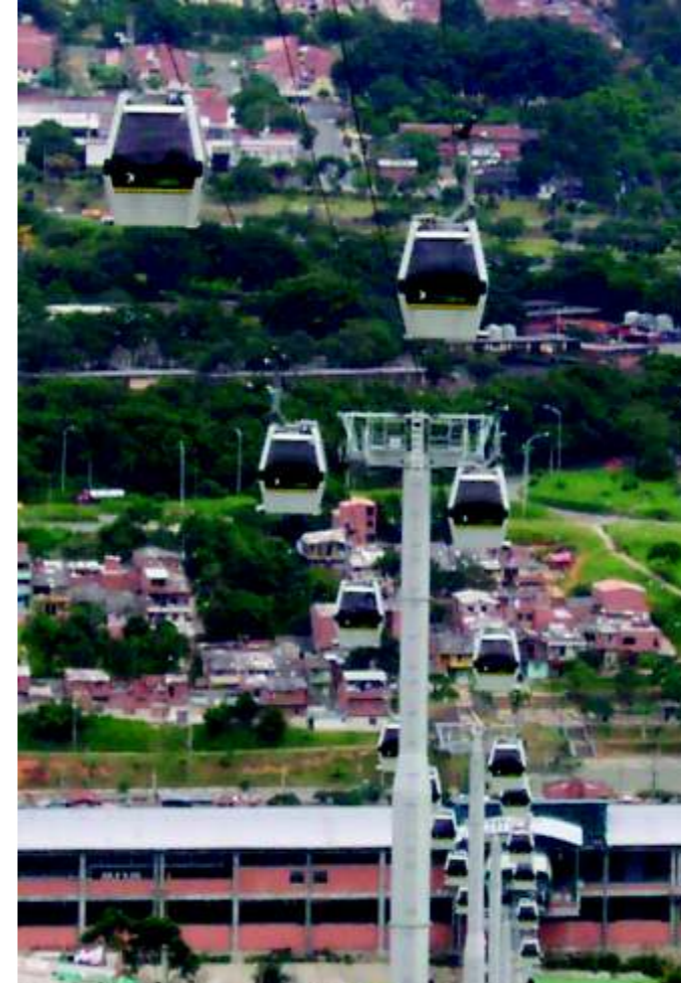
Panorama del sistema en servicio

BARRANQUILLA Calle 30 No. 1-25 Centro Ind. B/quilla. Tels.: (5) 334 4932 - 334 4934 Fax: (5) 334 4953 E-mail: barranquilla.ventas@co.sika.com