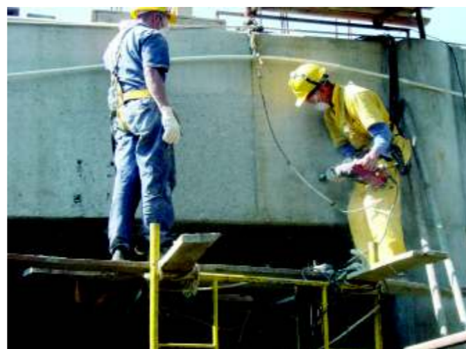
Figura 2. Limpieza y preparación de la superficie de las vigas aéreas.