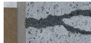
Reacción de la cal libre disuelta en el agua con el Sika MonoTop®-160 Migrating