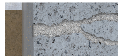
Capilar del concreto totalmente sellado con los cristales del Sika MonoTop®-160 Migrating