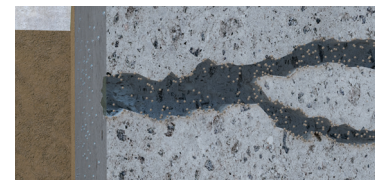
Capilares del concreto saturados con agua