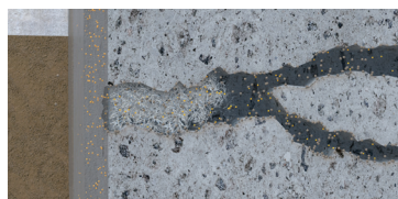
Inicio del proceso de cristalización del Sika MonoTop®-160 Migrating