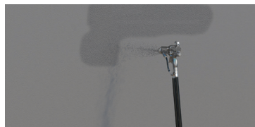
Aplicación con equipo de aspersión de baja presión (airless)