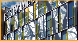
PEGADO Y SELLADO