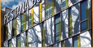
PEGADO Y SELLADO